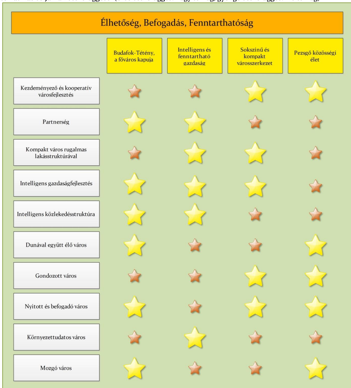
1. ábra: Budafok-Tétény Kerületi Településfejlesztési Konceptiójának településfejlesztési elvei, átfogó és tematikus céljainak összefüggései (erős összefüggés: nagy csillag, gyenge összefüggés: kis csillag)

A településfejlesztési elvek, az átfogó, illetve a tematikus célok egymással szoros kapcsolatban állnak. Amint az az elvek és célok ismertetése során kifejtésre került, valamennyi cél a három alapelv mentén került meghatározásra; a tematikus célok pedig önmagukban is biztosítják az átfogó célok megvalósulását – különböző mértékben. Az alábbi ábra strukturált képbe foglalja, mely tematikus cél melyik átfogó cél eléréséhez járul hozzá nagyobb (nagyobb csillagok) és kisebb mértékben (kisebb csillagok).